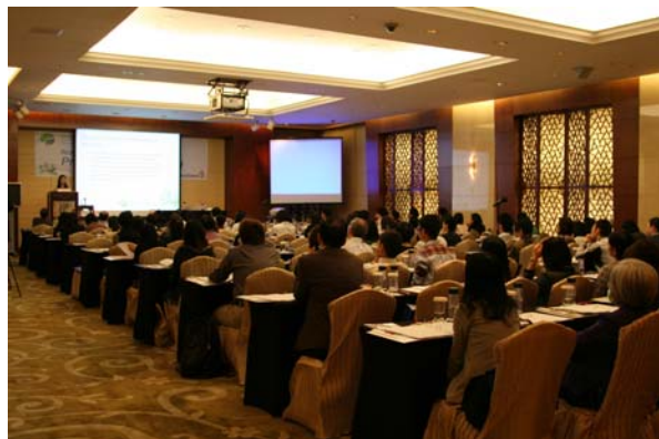
熱心的工作者聚精會神地聆聽個案分享