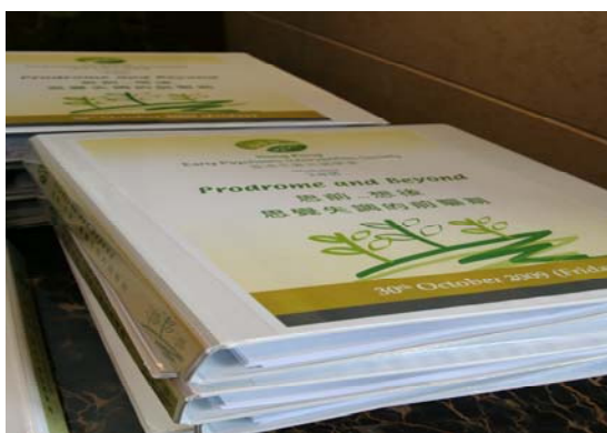
希望是在是次工作坊中所交流的經驗和心得,能有助同工日後的工作