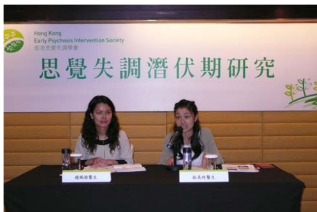
中午的記者招待會向公眾講解思覺失調的潛伏期