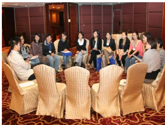
跨界別的小組討論,大家亦獲益良多