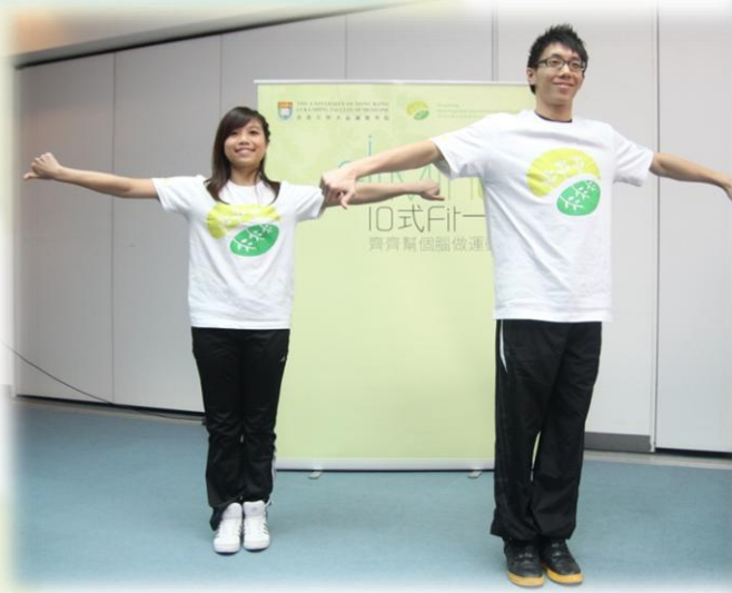
FitMind 大使示範由香港大學和思覺失調學會設計的 FitMind 十式